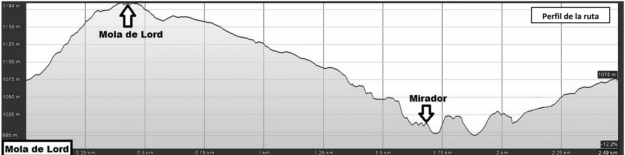
Perfil de la ruta