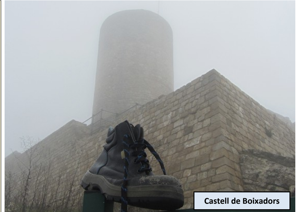
Castell de Boixadors

Podemos ver la Torre Maestra del castillo y la iglesia de Sant Pere de Boixadors, conjunto medieval en restauración, documentado del año 1015. Cuando hemos visto el conjunto y disfrutado de las vistas, volvemos al Coll del Castell.